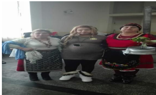
беше и томбола

2.2. По културния календар за 2018г- Първия празник, който е отпразнуван е 21.01- Бабинден. Общоселски празник- поканени бяха всички жени от селото. За доброто настроение на жените свири оркестър. Разиграна