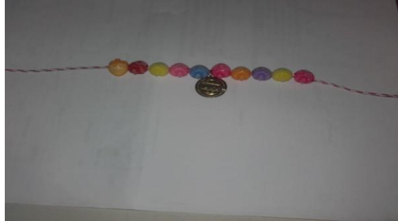
-Изготвено беше тъабло за 3-ти март