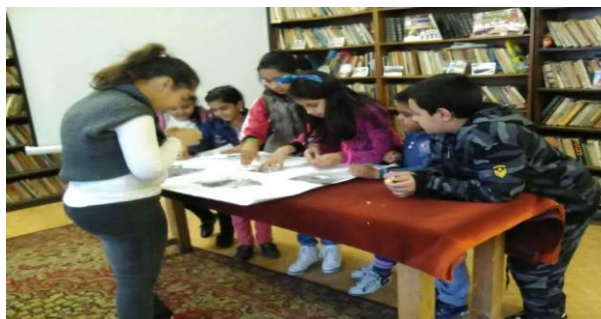
Табло за 24-май

Първи юни за деня на детето, бяха поканени всички деца в Читалището. Рисуваха на асфалт и